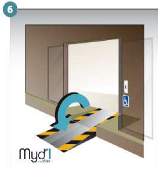
6 - Répéter les opérations pour la deuxième rampe.