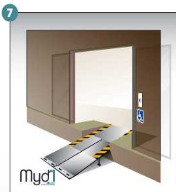
7- Rampe en service