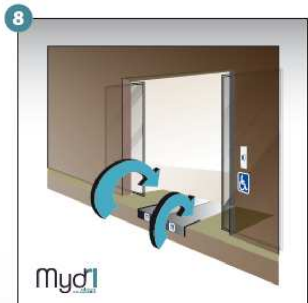
8 - Répéter les manoeuvres précédentes en sens inverse pour fermer la rampe.