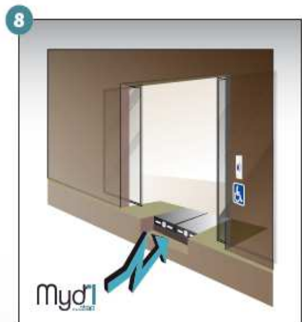
8 - Répéter les manoeuvres précédentes en sens inverse pour fermer la rampe