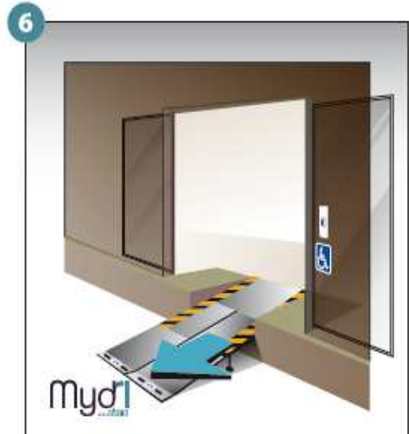
6 - Répéter les opérations pour le deuxième volet