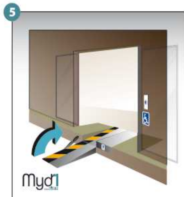
5 - Basculer la poignée qui fera office de chasse roues.