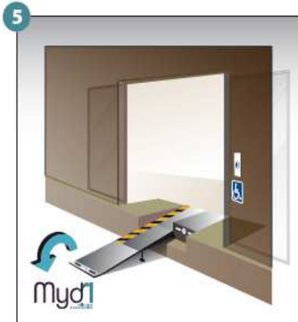
5 - Basculer la poignée qui prolongera la rampe