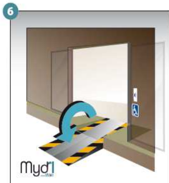
6 - Répéter les opérations pour la deuxième rampe.