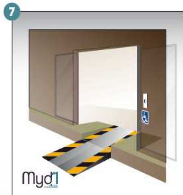
7- Rampe en service.