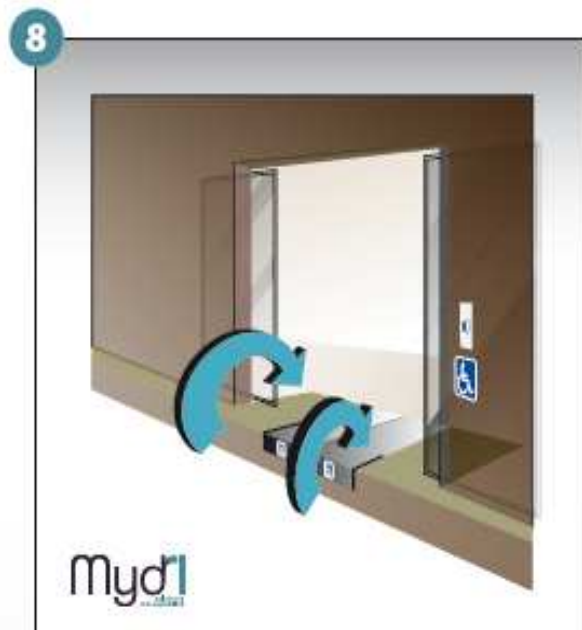
8 - Répéter les manoeuvres précédentes en sens inverse pour fermer la rampe.