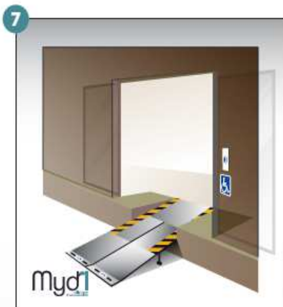
7- Rampe en service