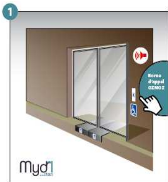
1 - Appel et prise en considération de la personne à mobilité réduite.