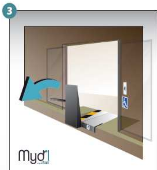
3 - Tirer la poignée vers l'avant.