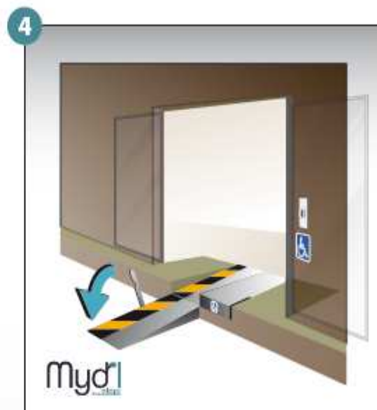
4 - Poser la rampe au sol.

ATTENTION : vous devez refermer la rampe après chaque utilisation Déploiement manuel de la rampe d'accès