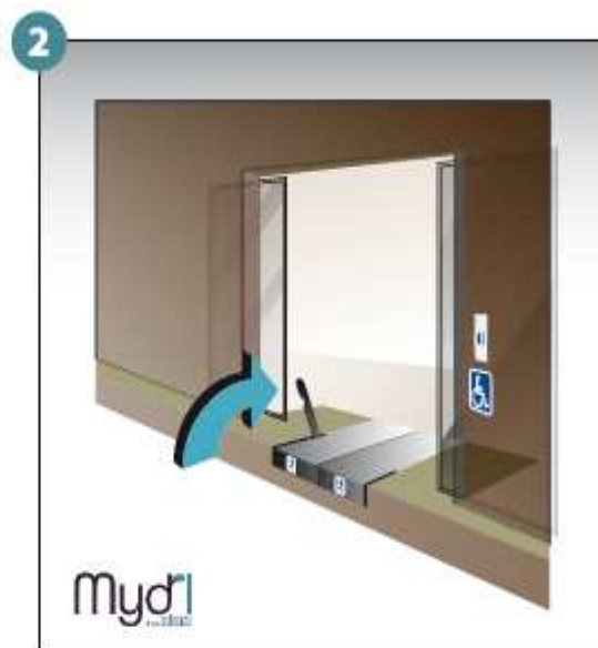
2 - Soulever la poignée coté gauche.