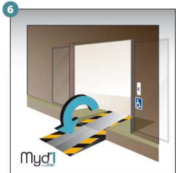
6 - Répéter les opérations pour la deuxième rampe.