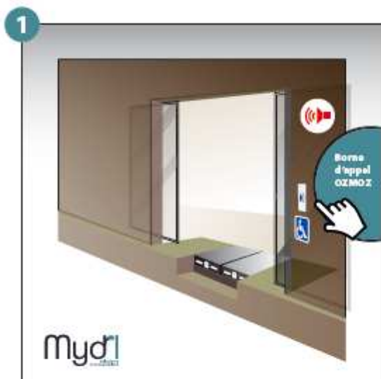
1 - Appel et prise en considération de la personne à mobilité réduite