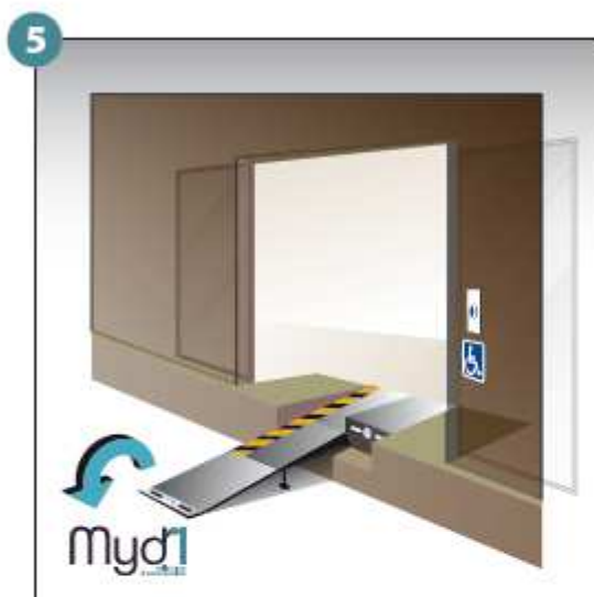
5 - Basculer la poignée qui prolongera la rampe