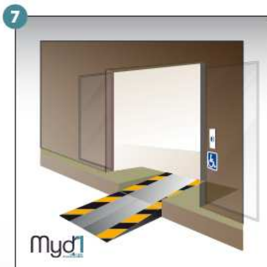
7- Rampe en service.