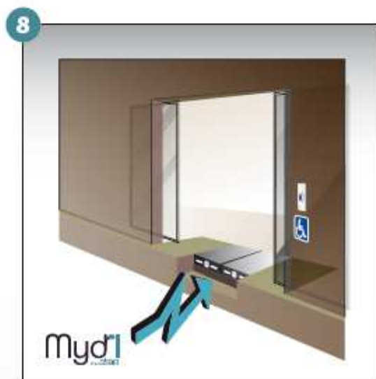
8 - Répéter les manoeuvres précédentes en sens inverse pour fermer la rampe