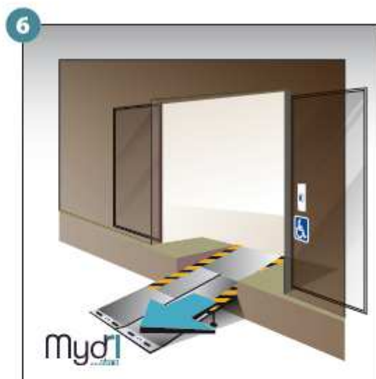
6 - Répéter les opérations pour le deuxième volet