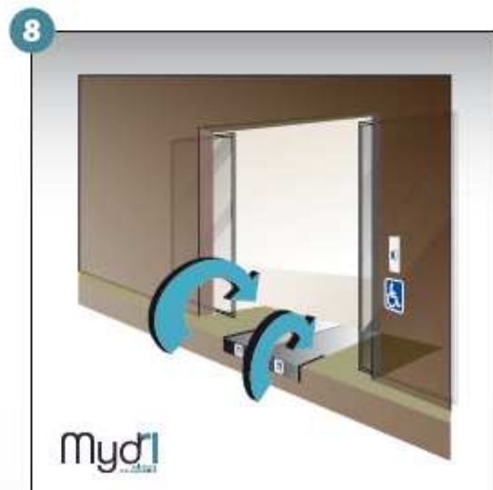
8 - Répéter les manoeuvres précédentes en sens inverse pour fermer la rampe.