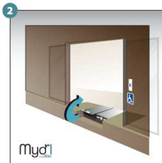
2 - Soulever le volet frontal.