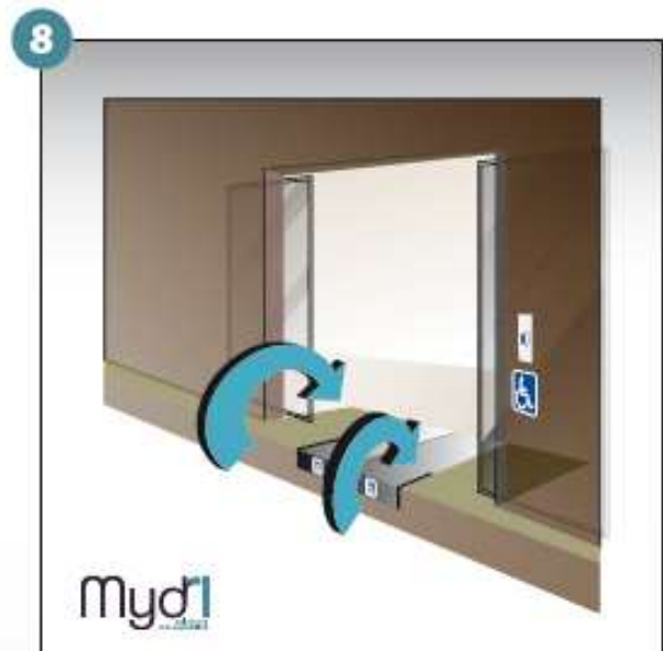
8 - Répéter les manoeuvres précédentes en sens inverse pour fermer la rampe.