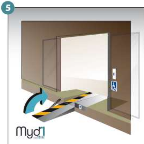
5 - Basculer la poignée qui fera office de chasse roues.