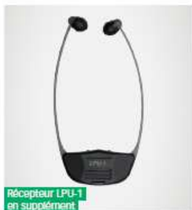
Récepteur LPU-1 en supplément