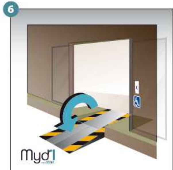
6 - Répéter les opérations pour la deuxième rampe.