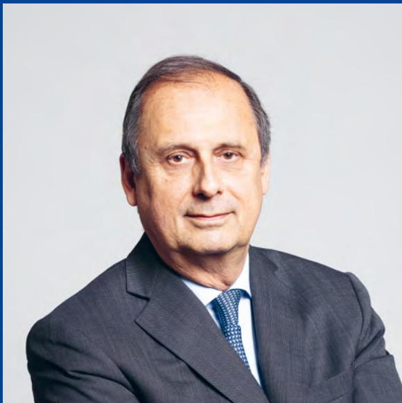
JÉRÔME RONCORONI DIRECTEUR GÉNÉRAL

Fière de ses valeurs et de sa signature « Assurément Humain » , GMF a mis en œuvre en 2022 des actions concrètes marquant son engagement sur les trois champs prioritaires de sa politique RSE, en accord avec la politique d'impact sociétal du groupe Covéa : l'accès aux savoirs et à l'éducation, l'environnement et l'égalité des chances.